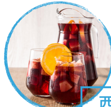
西班牙果酒 xībānyá guǒjiǔ