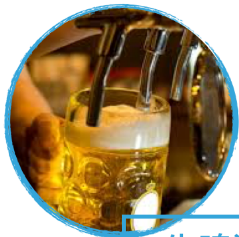
生啤酒 shēng píjiǔ