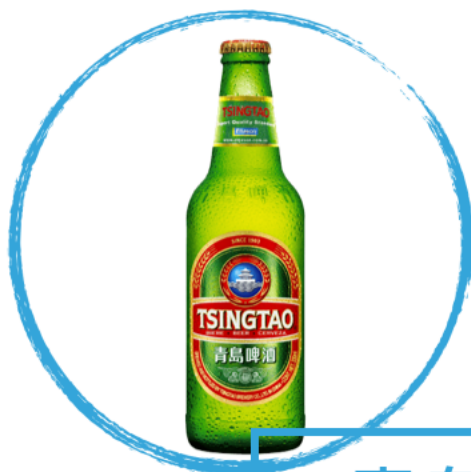
青岛啤酒 qīngdǎo píjiǔ