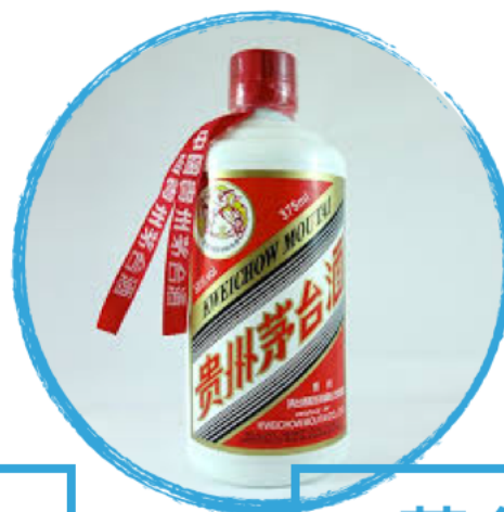
茅台酒 máotái jiǔ