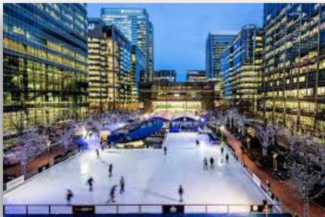
溜冰场 liūbīng chǎng