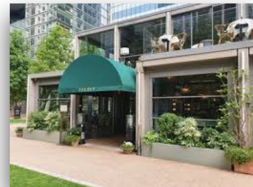
常春藤餐厅 cháng chūnténg cāntīng