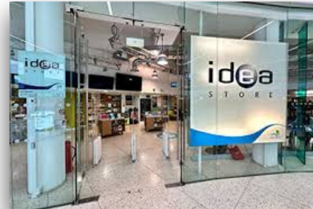
图书馆 túshū guǎn