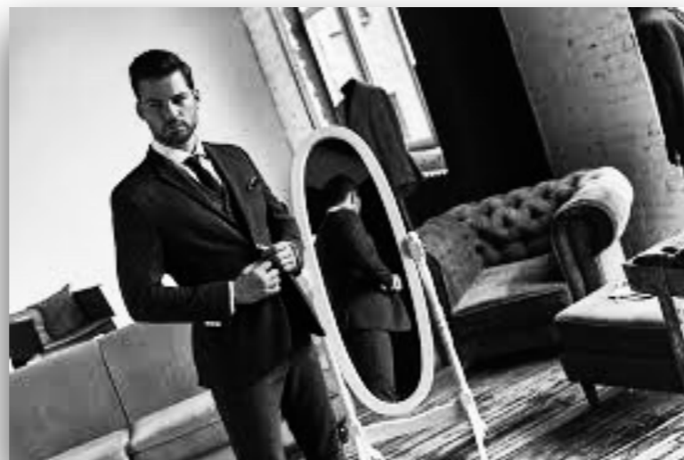
名牌服装 míngpái fúzhuāng