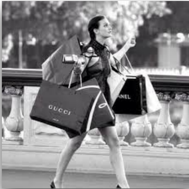
奢侈品购物 shēchǐ pǐn gòuwù