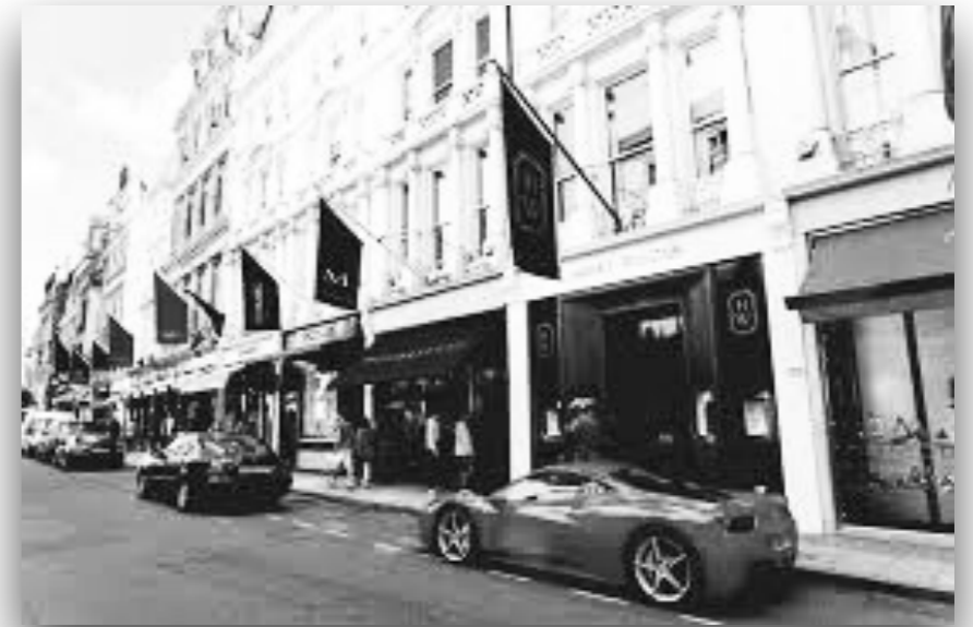
高端时尚 gāoduān shíshàng